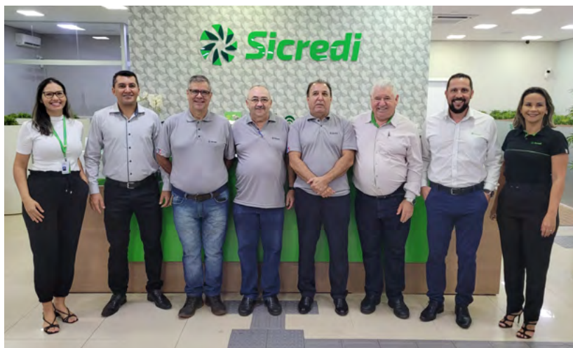
Primeiro dia dos colaboradores do Programa Geração Diamante, em Tangará da Serra, com Presidente e Gestores.