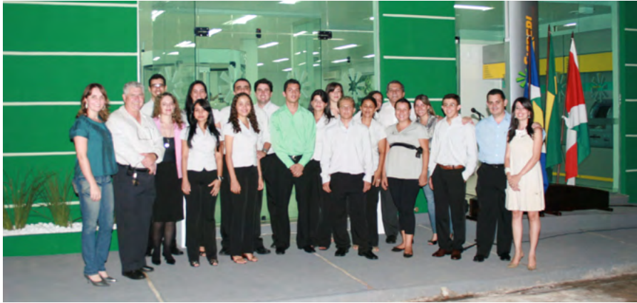
Inauguração da Agência de Mirassol d'Oeste.

A incorporação causou um sentimento de incerteza em alguns associados, mas que logo se normalizou ao verem a soma do patrimônio e quanto isso poderia representar em solidez e ampliação da carteira de crédito.