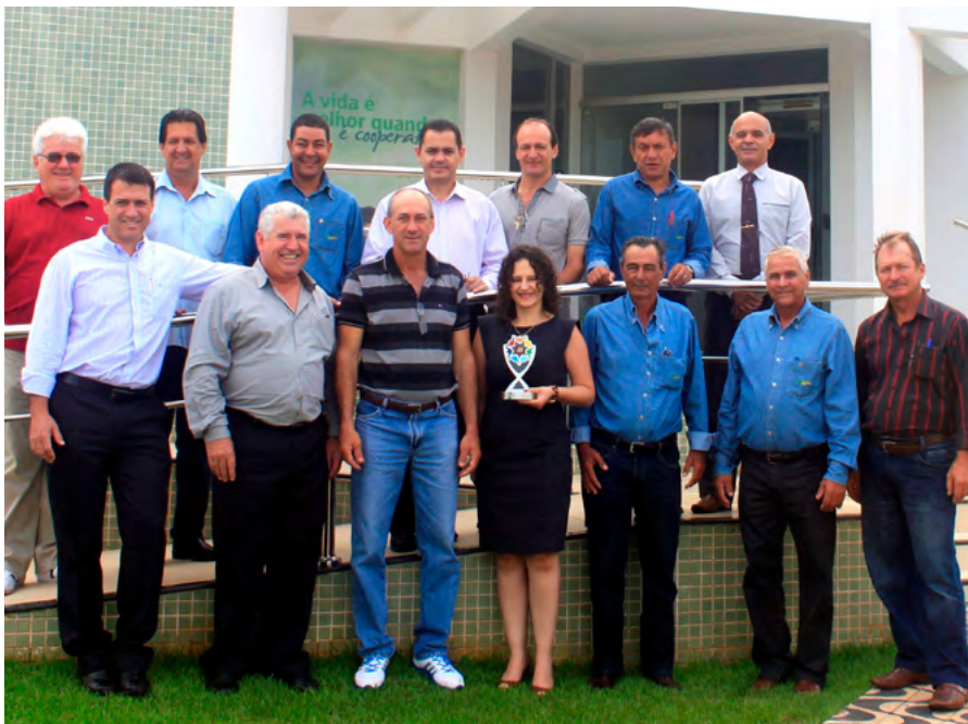
Conselho de Administração e Diretoria Executiva com o 1º Troféu de Reconhecimento do Prêmio SomosCoop Excelência de Gestão.

de negócio. É dar destaque a quem já está pensando hoje no cooperativismo de amanhã, avançando por meio da adoção e desenvolvimento de boas práticas de identidade cooperativista, governança e gestão, identificadas nas ferramentas de diagnóstico SESCOOP.