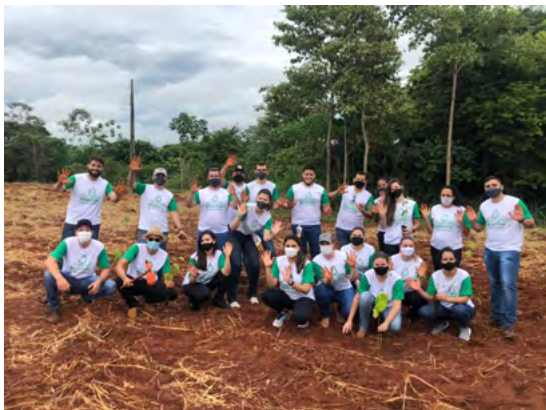
Ações do Programa Recuperando Nascentes, em Tangará da Serra.