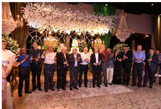
Sócios fundadores, conselheiros e diretores.

Ao completar 30 anos, os associados celebraram as histórias, lutas, conquistas e resultados que ultrapassam os números. A comemoração aconteceu em todas as cidades durante as Assembleias de Núcleos.