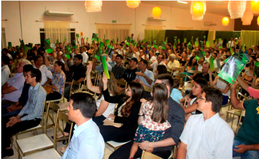
Assembleia de Núcleo com associados de Tangará da Serra, em 2014.

Cada Assembleia traz à memória histórias de associados, parceiros e colaboradores, que percorriam longas distâncias para realizar sempre a melhor Assembleia de todas. Cada dia em uma cidade, cada noite em um hotel e cada trecho uma emoção diferente, com ou sem atoleiros. Desafios recompensados com sorrisos, realização de sonhos e desenvolvimento local.