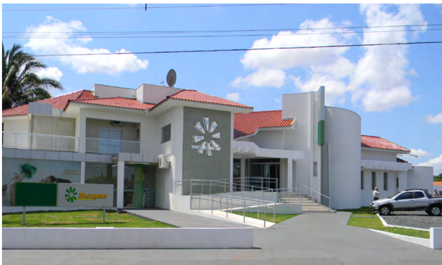
Sede Administrativa e Agência de Negócios Rio Preto em Tangará da Serra, 2012.

Em 2012, é eleita a primeira Diretoria Executiva da Sicredi Sudoeste MT dentro de um novo modelo de Gestão estruturada em Conselho de Administração, Conselho Fiscal e Diretoria composta por três membros. Este novo modelo de governança foi pensado e desenvolvido para aprimorar as estruturas normativas e gestão de riscos, alinhando as instituições cooperativas com as boas práticas de governança recomendadas pelo mercado e exigidas pelo Banco Central.