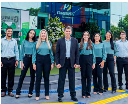
Equipe Agência Rua Vinte e Seis - Tangará da Serra.

A gestão voltada a entregas de excelência fez com que a Cooperativa fosse reconhecida novamente no Prêmio SomosCoop Excelência em Gestão, que acontece a cada dois anos. Do primeiro reconhecimento, em 2013, para hoje, foram 6 premiações recebidas, fruto da melhoria contínua estabelecida em processos e gestão.