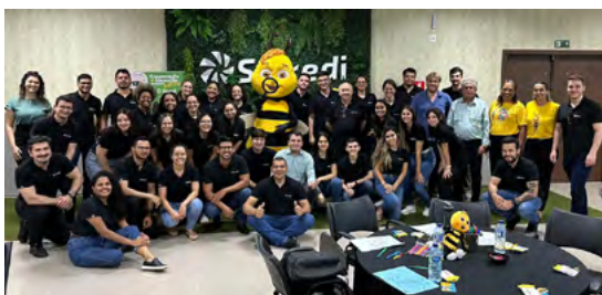
Colaboradores da Sede Administrativa participam de expedição investigativa do PUFV.

Todos os mais de 800 educadores passam por formações e aplicam a metodologia em sala de aula e fora dela, nas expedições investigativas. A pergunta exploratória acompanha cada etapa onde as crianças e adolescentes têm a oportunidade de fazer descobertas e serem verdadeiros protagonistas do seu aprendizado.