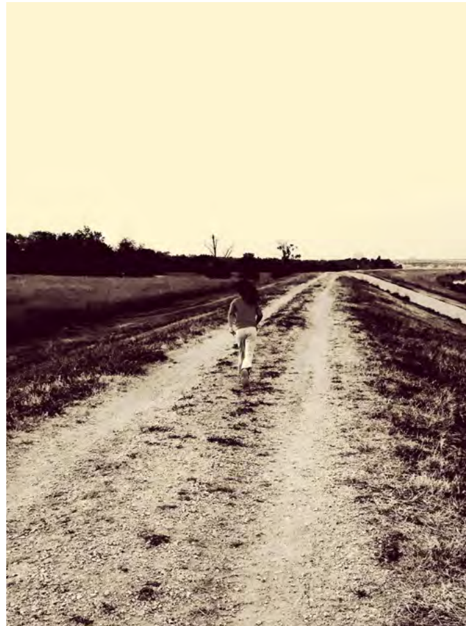
Estradas de chão batido marcaram o período.

Com o tempo e com a persistência dos que não desistiram, tudo foi melhorando. No caso dessa história, vai ficar claro ao leitor que o trabalho duro só deu certo porque, além de ter sido feito com vontade, foi feito em conjunto.