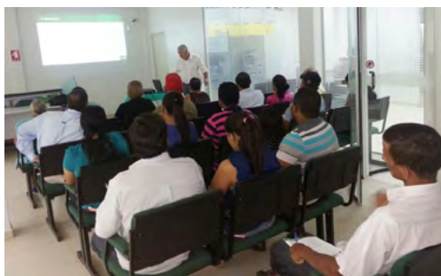
Reunião com associados no Programa Crescer.

Os programas foram implantados em 2011 na Sudoeste e constituem prioridades estratégicas e referencial de sustentabilidade da Cooperativa até hoje. Atualmente, o programa está disponível também na modalidade EAD em uma plataforma de cursos própria do Sicredi.