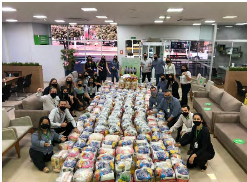
Cestas básicas arrecadadas pela equipe da Agência Tangará da Serra.

Neste primeiro ano, foram contemplados 32 projetos sociais de 16 cidades de Mato Grosso e Pará, beneficiando mais de 7.000 pessoas diretamente.