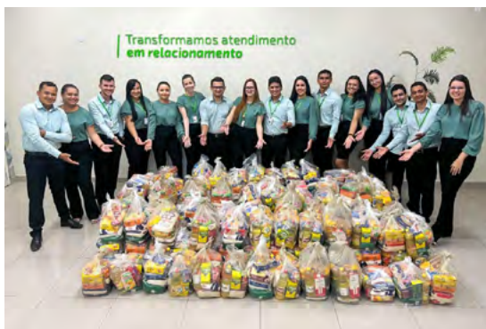
Arrecadação de cestas básicas no Dia C em Redenção.