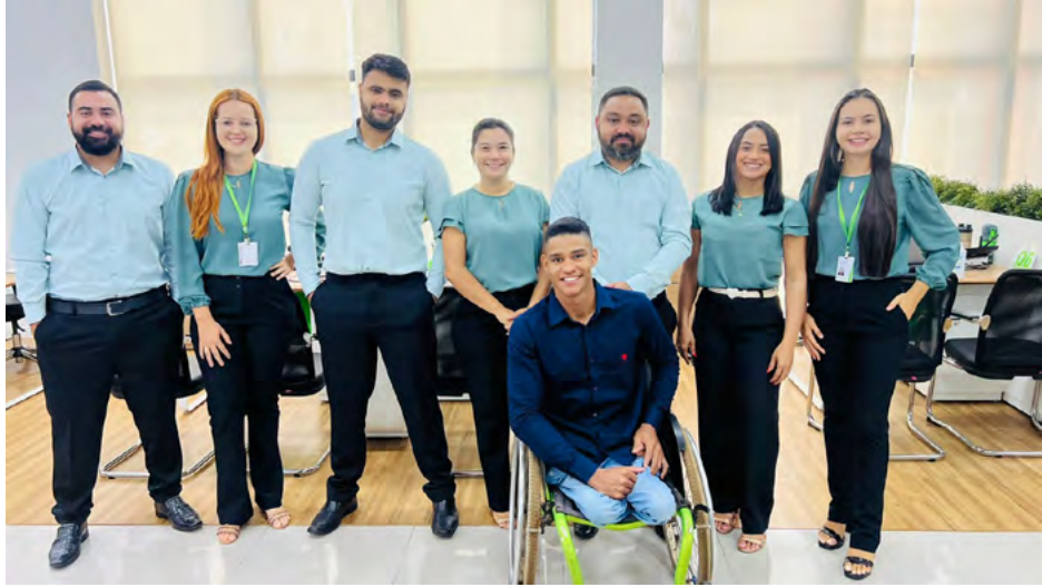
Equipe de Colaboradores de Conceição do Araguaia.