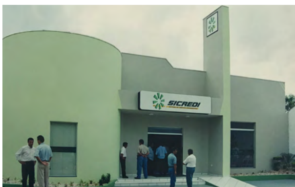
Inauguração da Agência de Barra do Bugres.

do capacitação de pequenos produtores, fomentando cadeias produtivas agrícolas e agroindustriais.