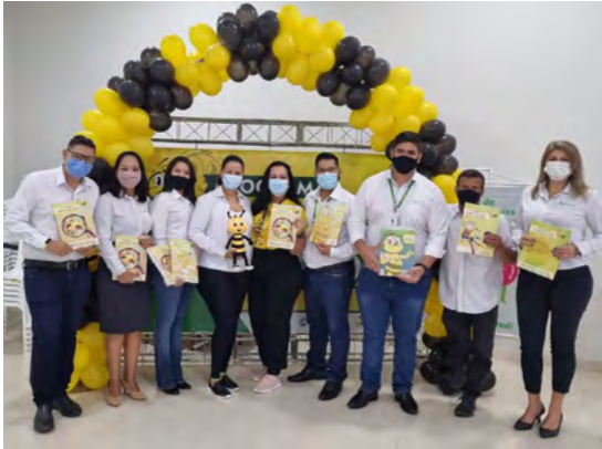
Colaboradores de Nova Olímpia.

A rede amplia em 2023 com a implantação do Programa em Denise (MT), impactando 43 educadores e 150 alunos em quatro escolas municipais, estaduais e especial.