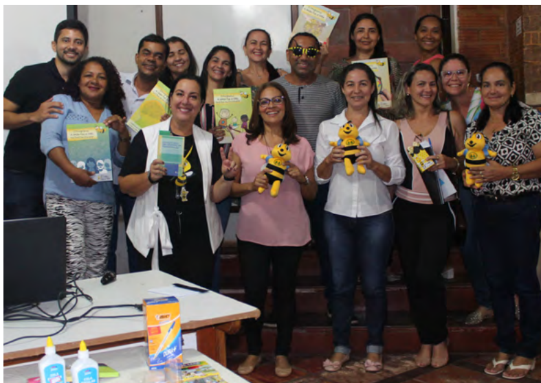
Habilitação dos professores de Paragominas na metodologia do Programa A União Faz a Vida.

O avanço digital foi um dos principais pontos de desenvolvimento neste ano. A necessidade de se reinventar em pouco tempo trouxe muitos avanços para os canais e acelerou a digitalização do Sicredi e das pessoas. Isso fortaleceu o modelo de negócios fisital, uma nova realidade que mistura ambientes remotos e digitais com espaços físicos para encontros presenciais. O fisital faz parte do conceito que consiste na entrega da mesma experiência em diferentes pontos de contato com o associado.