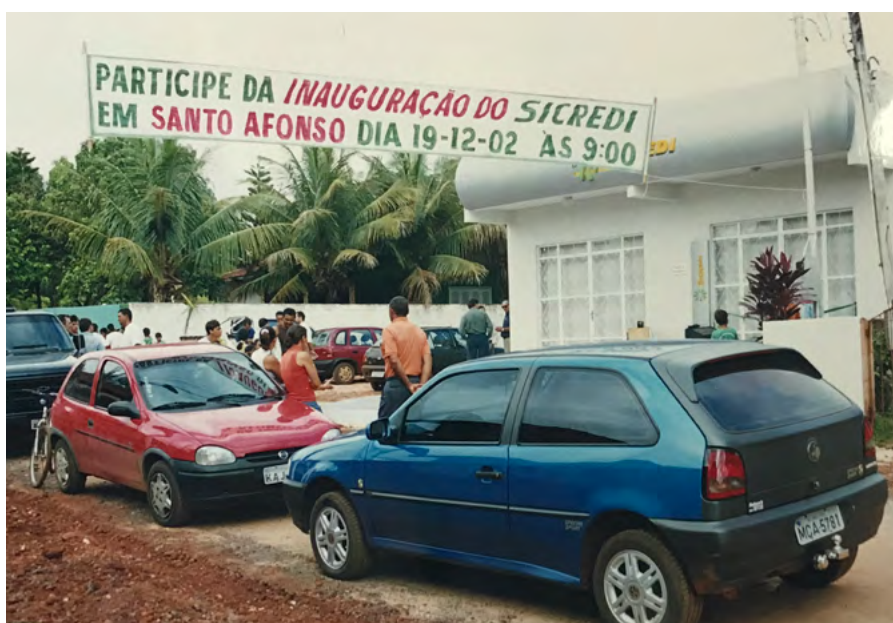
Inauguração Agência de Santo Afonso.

O ano fechou com a inauguração da Agência em Santo Afonso, município fundado em 1991, distante 60km de Tangará da Serra.