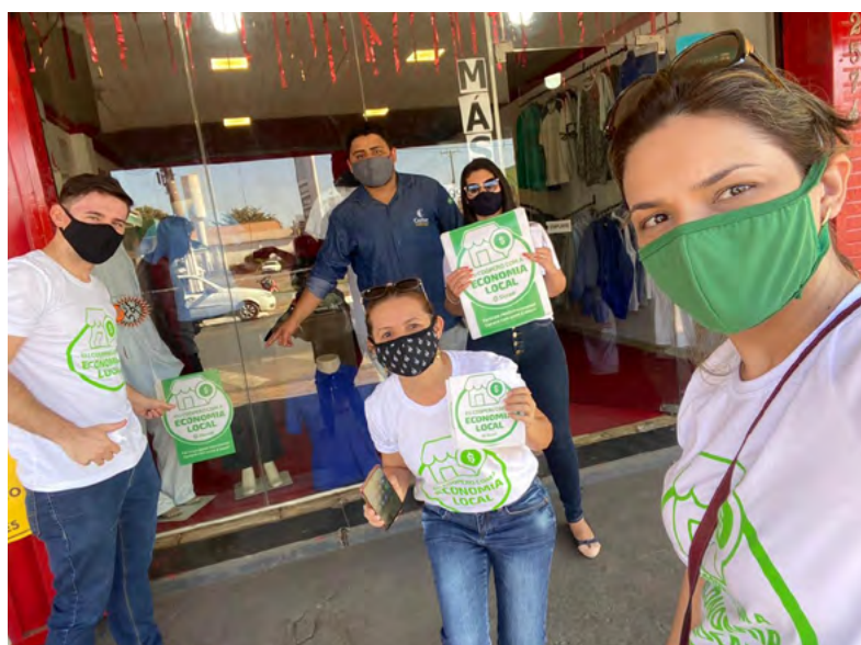
Colaboradores de Várzea Grande em visita ao comércio, no movimento Eu Coopero com a Economia Local.

Os canais digitais e o WhatsApp Enterprise, canal oficial do Sicredi, ganharam novas versões e investimentos, para garantir que o associado pudesse ser atendido mesmo sem precisar ir até a agência. As agências atendiam presencialmente de forma contingenciada, respeitando todas as regras e decretos municipais, estaduais e federais que indicavam o distanciamento mínimo entre as pessoas, quantidade de pessoas por metro quadrado e utilização da máscara de proteção. Muitas agências precisaram cessar completamente o atendimento em razão dos períodos de lockdown, que determinaram o fechamento de todos os estabelecimentos em razão do número de ocorrências.