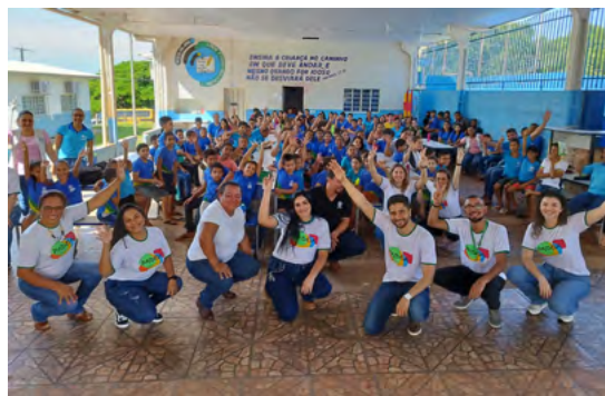
Voluntários do Projeto Paideia, em ação com a comunidade de Tangará da Serra.

com a oficina de laços, contribuiu para que jovens encontrassem sua vocação profissional, bem como permitiu que crianças, jovens e adultos despertassem para o aprendizado constante.