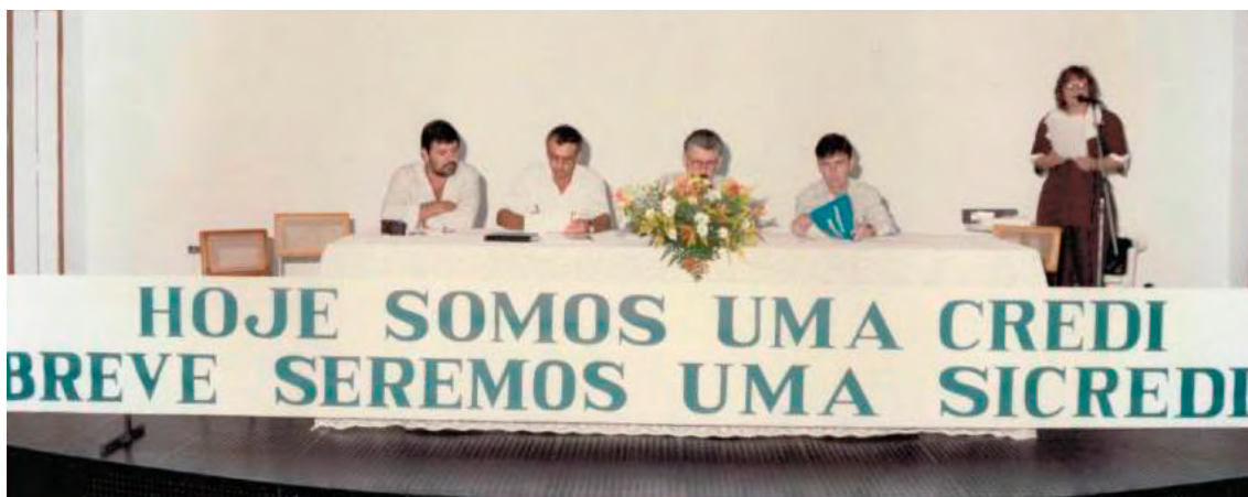
Em 7 de março de 1997, Assembleia de adesão ao Sistema Sicredi.

Com um banco próprio e com uma marca única, a Cooperativa conseguiu ofertar mais produtos aos associados e atender a todas as necessidades financeiras do setor rural, com acesso às linhas de crédito do BNDES. Mais produtos significava mais oportunidades de conquistar associados e a credibilidade de toda a comunidade. Chegava a hora de ampliar a rede de atendimento!