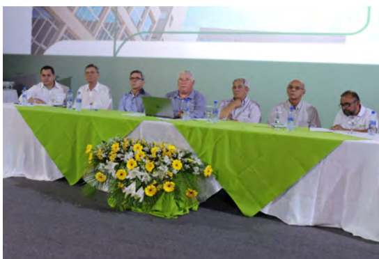
Assembleia Geral Extraordinária de Incorporação.

Este foi um dos grandes desafios enfrentados pela Cooperativa, mas ainda que fosse muito novo, um outro Estado com diferentes culturas, uma coisa era certa para Presidente, Conselheiros e Diretoria: esta era a grande oportunidade para crescer e transformar a Cooperativa em uma das maiores do país. A decisão foi tomada após muita análise e Assembleias com os associados de Mato Grosso e Pará. O processo de incorporação foi estabelecido em 3 de outubro de 2016, com a Assembleia Geral Extraordinária, realizada em Várzea Grande – MT.