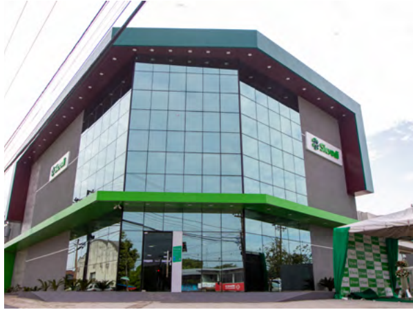
Agência de São Miguel do Guamá - PA.