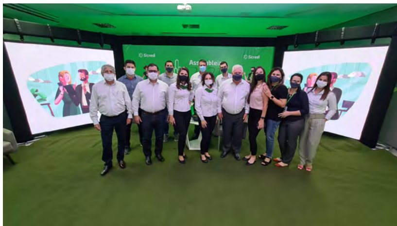
Conselho de Administração, Diretoria e Equipe de colaboradores no estúdio montado para transmitir a Assembleia.

O cenário econômico e social no país, ocasionado pela pandemia, continuava atingindo a população, que por vezes não tinha alimento em casa. Como agente de desenvolvimento, a Cooperativa realizou em 2021 a maior campanha de arrecadação e doação de alimentos da sua história, alcançando mais de 100 toneladas. A ação mobilizou grande número de pessoas, entre doadoras e voluntárias e beneficiou mais de 7,5 mil famílias.