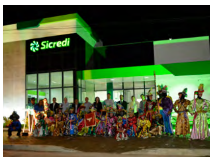
Inauguração Agência Poconé com apresentação cultural do grupo Mascarados.

Neste momento, a Cooperativa já possuía 22 agências e uma forte presença no Estado de Mato Grosso, o que levou os dirigentes da Sicredi Sudoeste a vislumbrarem novos horizontes. E com a solidez que a Cooperativa apresentava, a oportunidade surgiu para conhecer o Sudeste do Pará. Uma região rica em extrativismo mineral e de madeira, com exportação de alumínio e ferro e também forte na agroindústria e pecuária.