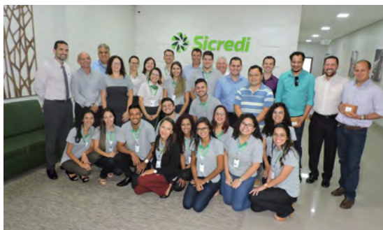
Primeira turma do Programa Start.

Em 2018, a Sicredi Sudoeste implantou o Programa Start, com o objetivo de formar jovens estudantes com alto potencial de crescimento profissional. Diferente de um estágio comum, o programa oportuniza o aprendizado em diferentes áreas da Cooperativa, desenvolvendo assim suas habilidades e preparando-os para novas oportunidades.