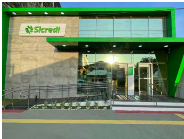
Agência de Acará - PA.