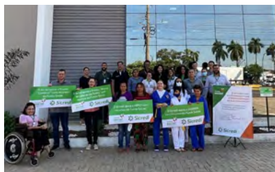
Entrega das placas simbólicas a projetos beneficiados em Cáceres.