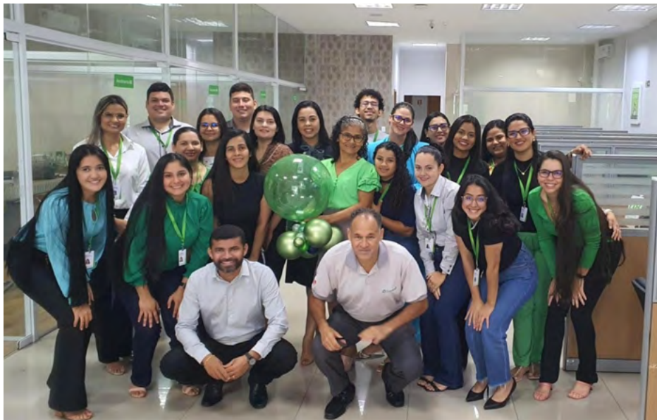
Programa Geração Diamante completa um ano. Foto da comemoração em Paragominas.