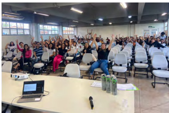
Uma das reuniões do Programa Crescer.