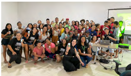
Cooperação Na Ponta do Lápis, em Várzea Grande.

Esta parceria rendeu a participação de milhares de crianças nos encontros para falar de educação financeira de uma forma lúdica. As equipes da Sudoeste percorreram as escolas locais para difundir conhecimento sobre o tema.