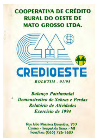
Capa dos Relatórios de 1994.

ve inadimplência de produtores e de cooperativas durante essa época tão turbulenta. Das 26 cooperativas que já existiam no Mato Grosso, apenas 16 permaneceram abertas, entre elas, a Credioeste.