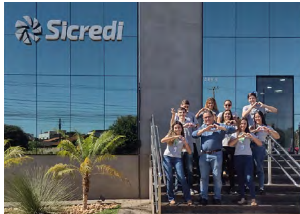
Colaboradores do Programa Start com o Diretor Executivo.