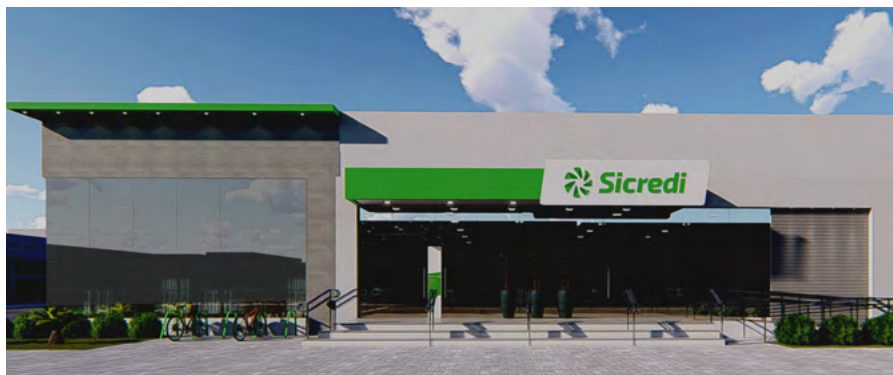
Agência Cidade Alta - Tangará da Serra.