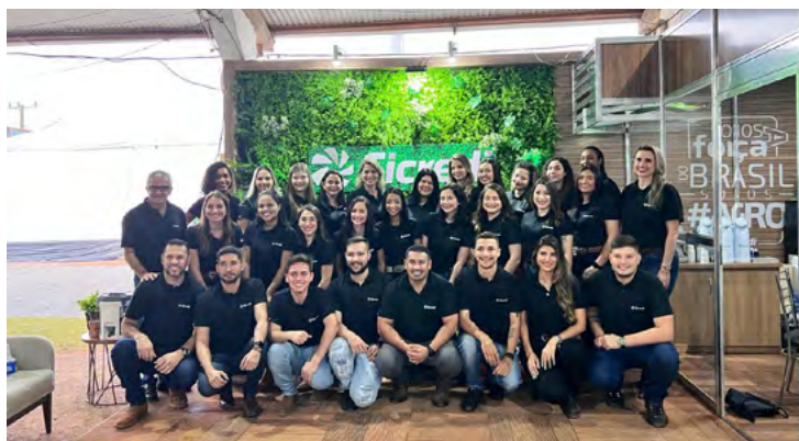
Participação na feira Parecis SuperAgro de Campo Novo do Parecis.

Com presença em tantos municípios, era grande também o número de ações desenvolvidas pelas equipes, sejam eles em eventos patrocinados ou de realização própria, como feiras agropecuárias, feirões de veículos, plantões de atendimento com as Agências Móveis, voluntariado e tantas outras que fizeram deste um ano intenso, de grandes realizações e conquistas.