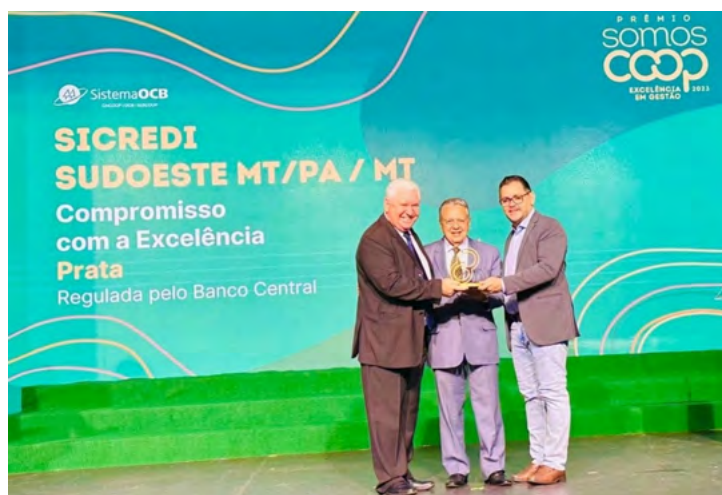
Prêmio SomosCoop Excelência de Gestão 2023.

A participação no Programa de Desenvolvimento da Gestão das Cooperativas (PDGC) tem grande relevância na conquista de cada um destes reconhecimentos, onde a Cooperativa entende e identifica pontos de melhoria para tornar a gestão mais transparente e eficiente, resultando sempre em benefício para os associados.