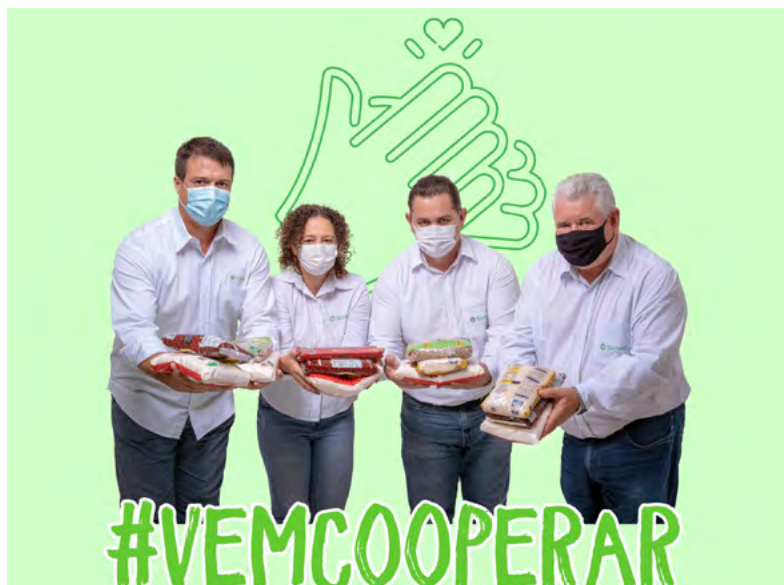
Presidente e Diretores durante a campanha de arrecadação de alimentos.

O cenário econômico e social no país, ocasionado pela pandemia, continuava atingindo a população, que por vezes não tinha alimento em casa. Como agente de desenvolvimento, a Cooperativa realizou em 2021 a maior campanha de arrecadação e doação de alimentos da sua história, alcançando mais de 100 toneladas. A ação mobilizou grande número de pessoas, entre doadoras e voluntárias e beneficiou mais de 7,5 mil famílias.