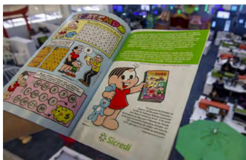
Parceria com Maurício de Sousa Produções.

Em 2018, em parceria com a Maurício de Sousa Produções, o Sicredi lançou uma série de educação financeira com seis gibis e seis histórias em vídeo da Turma da Mônica que explica temas como a origem do dinheiro, orçamento familiar e como funcionam compras à vista ou a prazo. Além dos gibis e vídeos, há vários conteúdos especiais que ajudam os pequenos a entender ainda mais sobre o assunto no site do Sicredi.