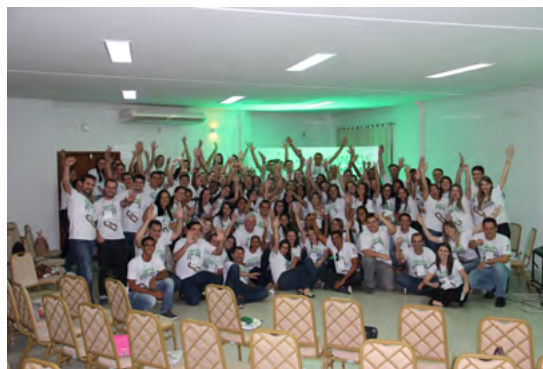
Evento de integração com os colaboradores do Pará em Parauapebas - PA.

Este é um processo que une diferentes culturas e hábitos, onde o acolhimento é o primeiro passo para fortalecer a cultura da empresa. Depois, entra um trabalho intenso de formação dos colaboradores, imersão nas rotinas e políticas praticadas e a mescla de colaboradores dos dois Estados.