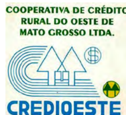
Identidade visual adotada na época.

associados. Diante do resultado negativo, alguns deles desistiram e saíram da Cooperativa. Mas este seria apenas um dos muitos obstáculos que seriam superados.