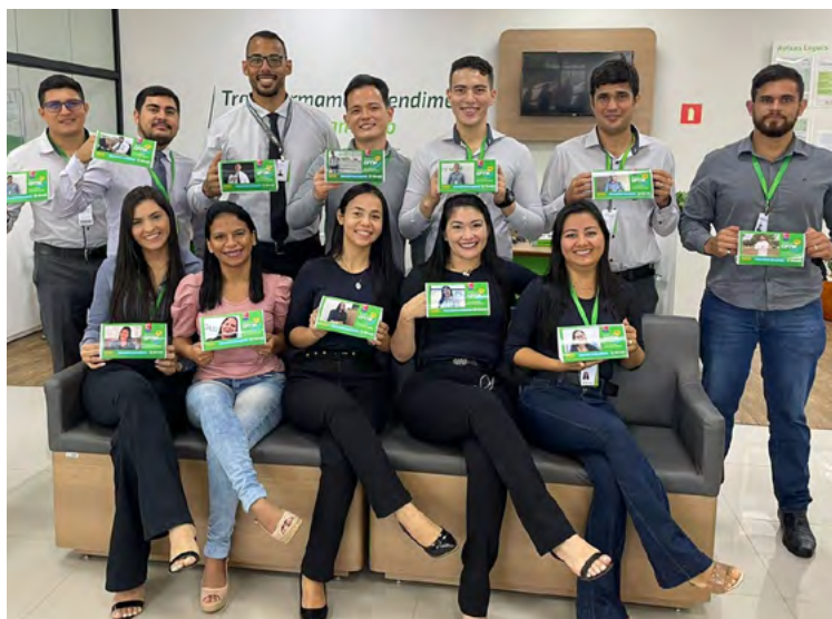
Comemoração em Tomé-Açu ao reconhecimento GPTW.

ministrativas e comerciais. Atualmente, 106 participam do Programa. Os processos seletivos atraem grande público que enxerga no Sicredi uma ótima empresa para iniciar a carreira.