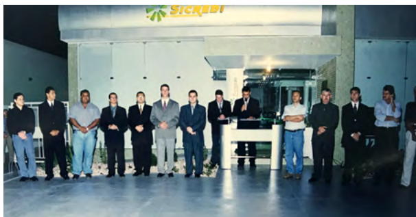
Reinauguração da Agência Tangará agora em seu prédio próprio.