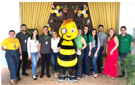
Mostra de Projetos em Sapezal.

Neste mesmo ano, 2016, os educadores de Sapezal também iniciaram com o Programa, aplicando a metodologia e já realizando a mostra de projetos no final daquele ano. Atualmente, é a cidade que mais tem alunos frente a outros municípios da Cooperativa com 4,7 mil alunos e 97 educadores em 10 escolas.