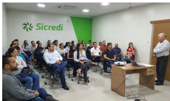
Encontro do Programa Pertencer.