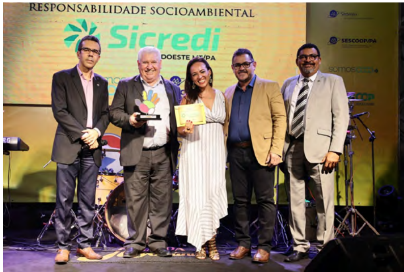
Entrega do reconhecimento no Prêmio SomosCoop Pará.