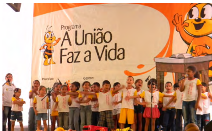
Primeira Mostra de Projetos do Programa A União Faz a Vida, em Nortelândia - MT.

O PUFV é um Programa Educacional criado para promover atitudes e valores de cooperação e cidadania junto a crianças e adolescentes no Brasil. A intenção é transformar para melhor a realidade dos alunos, de suas famílias e comunidades. Ao promover a educação para um mundo mais cooperativo, inspira professores, estudantes e comunidades, a partir de metodologia educacional própria, fundamentada no desenvolvimento de projetos.