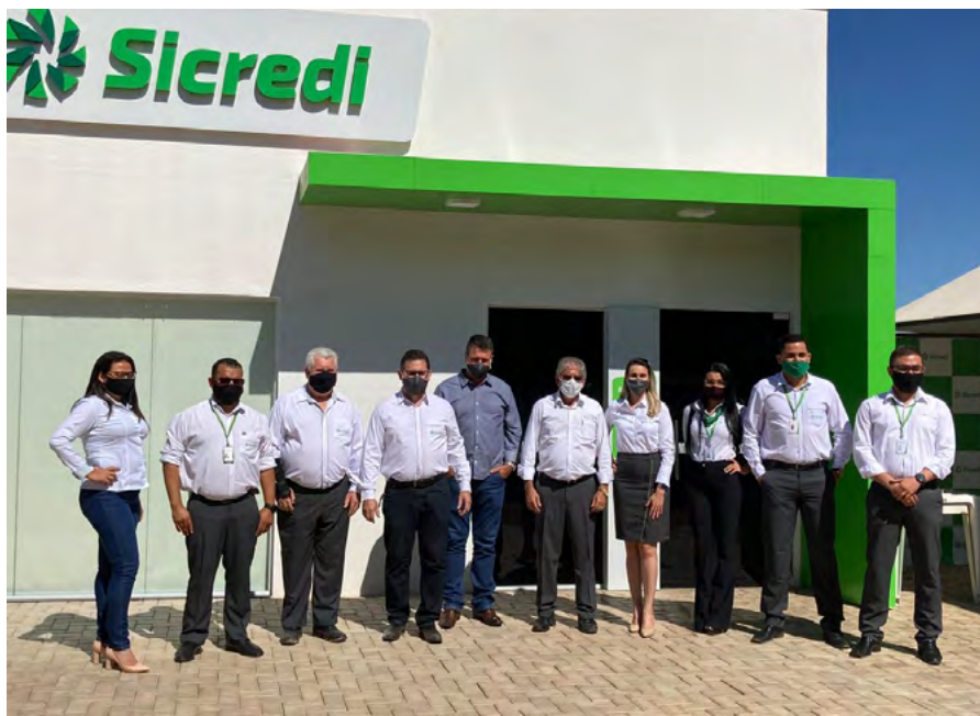
Inauguração da Agência de Porto Estrela.

Em maio, a Agência de Abel Figueiredo (PA) iniciou suas atividades. Em agosto, foi a vez de Porto Estrela (MT) e Ulianópolis (PA).