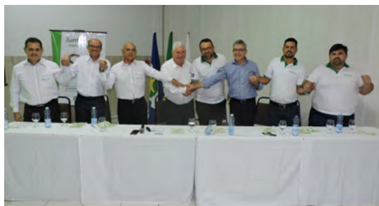
Assembleia Extraordinária de incorporação da Sicredi Verde Pará.

grande plano de atuação para atender os associados destas cooperativas e de toda a região, fortalecendo a marca Sicredi e ampliando ainda mais a rede de atendimento.