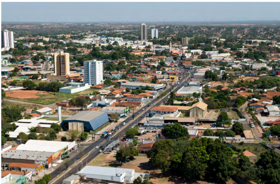
Imagem aérea de Várzea Grande - MT.

Este é outro importante momento para a Sicredi Sudoeste, que até então atuava em cidades do interior do Estado e agora passa a atender associados de um grande centro, com mais de 250 mil habitantes na época.