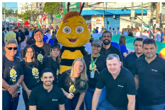
Programa A União faz a Vida nas ruas de Várzea Grande

em três escolas. Nova Marilândia tem hoje 400 alunos 18 professores em uma escola municipal e Várzea Grande tem mais de 900 alunos e 44 professores em duas escolas.