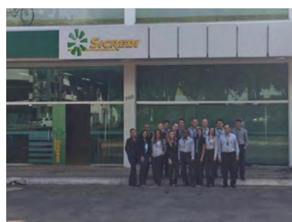
Agência de Redenção - PA.

As agências estavam localizadas em sete municípios, sendo eles: Redenção, inaugurada em 2007; Parauapebas, no bairro Cidade Nova, inaugurada em 2009, Canaã dos Carajás, em 2010; Marabá, em 2011; Xinguara, em 2013, Rio Maria, em 2014 e, em 2015, em Tucumã e mais uma agência em Parauapebas, agora no bairro Cidade Jardim.