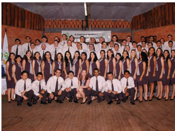
Colaboradores das Agências da Cooperativa em 1999.

Neste mesmo ano, 2001, é inaugurada a Agência de Sapezal, em 16 de novembro. Cidade forte no agronegócio que abraçou o cooperativismo e todos os benefícios gerados por ele. O município é hoje um dos maiores produtores de algodão do Estado.