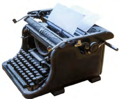
Máquina de datilografia utilizada na época.

Os olhares se voltavam ao Sicredi e mais pessoas passavam a conhecer este modelo de negócio cooperativo. A ampliação do atendimento dependia da contratação de novos colaboradores, o que era uma das grandes dificuldades da época. Foram realizados grandes processos seletivos para encontrar mão de obra que atendesse às necessidades do negócio.