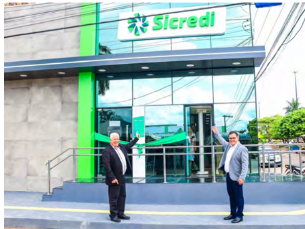
Inauguração da Agência Nova Ipixuna - PA.