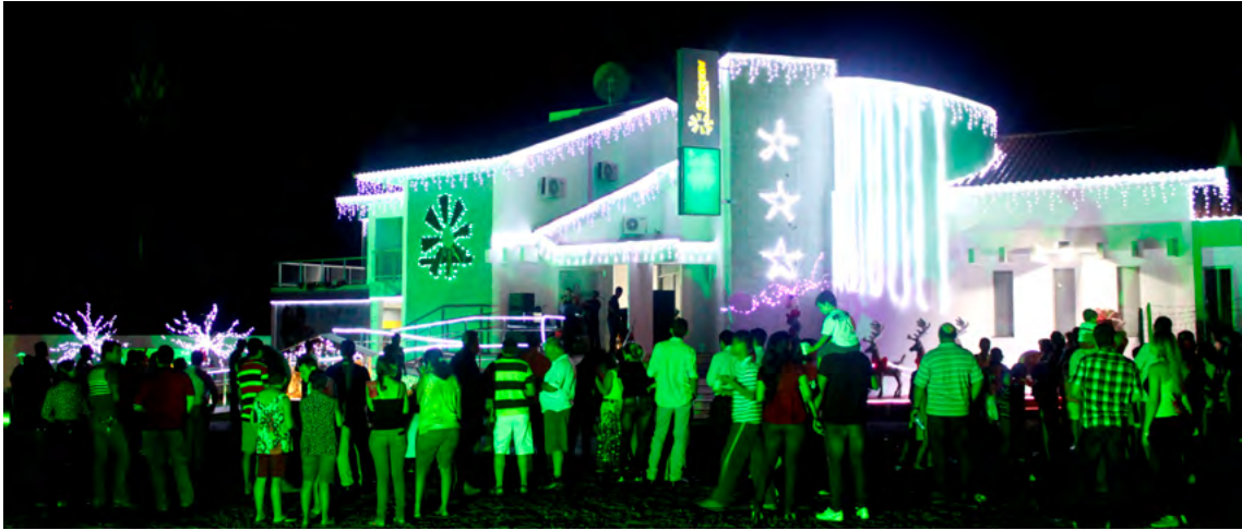
1ª Edição do Natal de Luz na Sede Administrativa da Cooperativa, em Tangará da Serra.