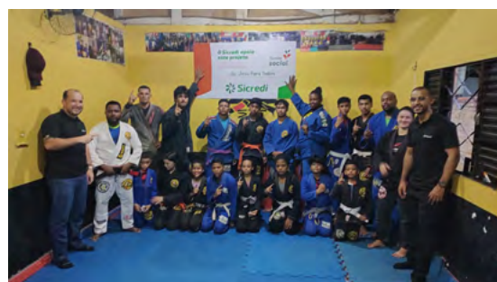
Projetos beneficiados pelo Fundo Social em Bom Jesus do Tocantins e São Geraldo do Araguaia.