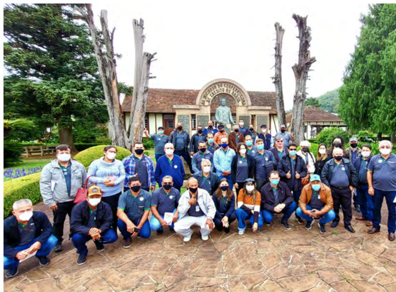
Coordenadores(as) de Núcleo na Praça Theodor Amstad, em Linha Imperial, Nova Petrópolis - RS.