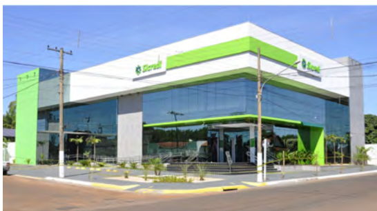
Novo prédio, em 2017.

Neste momento, o número de colaboradores, se aproximava de 500 e o grande foco era o desenvolvimento dessas equipes e atração de novas pessoas para formar uma base de mão de obra qualificada para possibilitar o crescimento sustentável da Cooperativa.