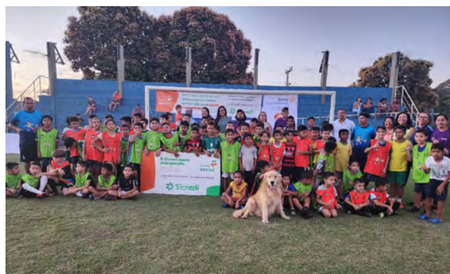
Porto Esperidião recebe recursos do Fundo Social para projetos da comunidade.