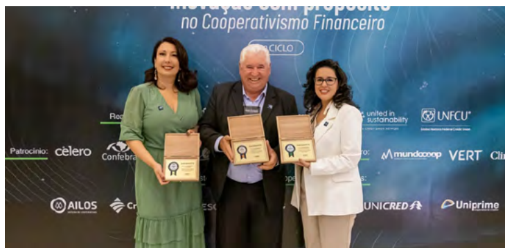
Reconhecimento Inovação com Propósito, recebido pelo Presidente.

mio promovido pela Federação Nacional de Associações dos Servidores do Banco Central (Fenasbac), com apoio do Banco Central e do Sistema OCB, a entidade que reúne todas as cooperativas do Brasil. O objetivo do RECIPI é reconhecer as cooperativas de crédito brasileiras que inovam e são referência para alavancar a inovação no setor.