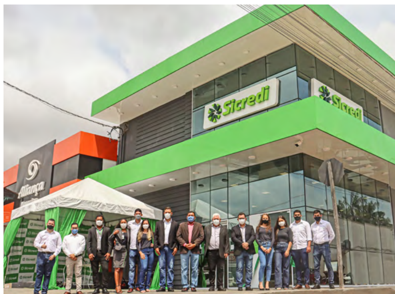
Inauguração da Agência Itupiranga - PA.