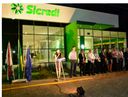
Inauguração Agência Metropolitana em Várzea Grande.

A nova comunicação visual das agências já estava em produção para a inauguração da Agência Metropolitana, a quarta da cidade de Várzea Grande, e Agência Poconé, em setembro e outubro de 2016, respectivamente. Elas representavam o início de um novo design ambiental das agências e o desejo em fortalecer a presença na cidade de Várzea Grande e proporcionar melhor qualidade de vida para a população com atendimento próximo e de qualidade.